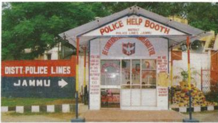
Police Help Booth installed by Jammu Police.