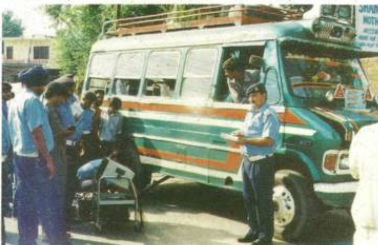
Special drive by Traffic Police, Jammu, against emitting of excessive smoke by vehicles.

In its continued campaign against Environmental Pollution, Traffic Police Jammu detected 3524 vehicles