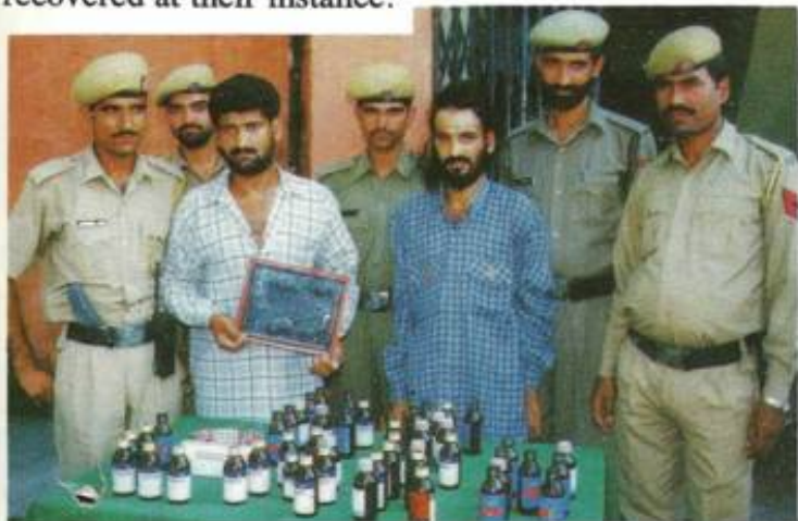
Drug Peddlers arrested by Lakhanpur Police and the seized consignment.