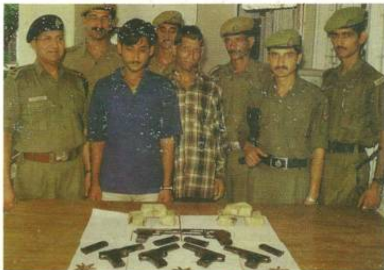
Weapons and Ammunition recovered by Akhnoor Police