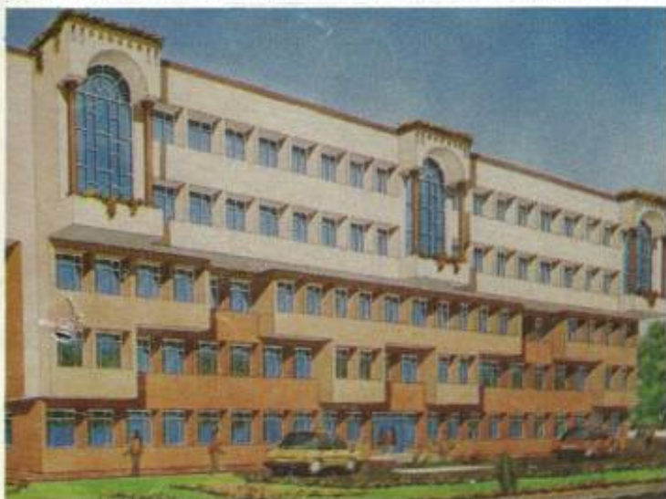
Model of Administrative Block, under construction at Jammu

J&K Police Housing Corporation, set up to focus on providing better housing to Police personnel and to meet