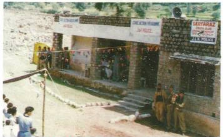
Sarfaraz Youth Club, Harni (Mendhar), inaugurated by Commandant XIII Bn. under Civic Action Programme.

XIII Bn. of J&K Armed Police in collaboration with youth club Draba (Surankote), organised an inter-school seminar at Draba on Sep 27. The topic of the seminar was-"National integration is the need of the hour". Students, both male and female, drawn from Higher Secondary Schools Buffliaz, Fazal-Abad and Draba participated in the seminar. The seminar was attended by a large number of students, prominent citizens, civil and Police officers. English dictionaries were distributed amongst the participants, as mementoes, by the organisers.