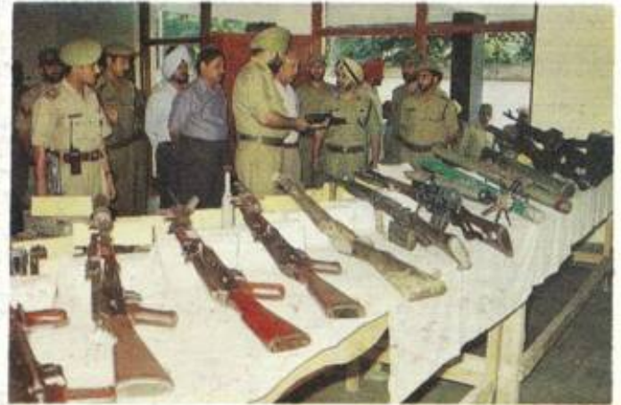
Recoveries made by STF Srinagar on display