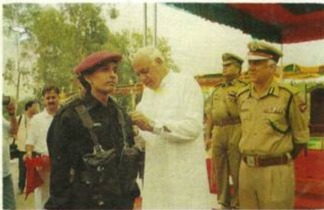
Dr Farooq Abdullah, Chief Minister, pinning ranks on the all-round-best women constable at a POP at Police Academy, Udhampur

Chief Minister, Dr Farooq Abdullah, while commending the performance of J&K Police has shown his desire to further develop the facilities in the Sher-e-Kashmir Police Academy at Udhampur for providing training on scientific lines. He announced setting up of a governing body