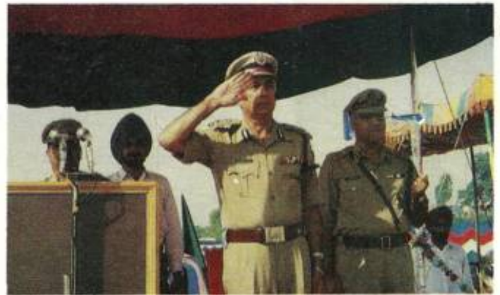
Sh Gurbachan Jagat, DGP, taking salute at POP in I. R Police Training centre, Vijaypur (Jammu)

salute and distributed prizes amongst meritorious trainees in a batch of 402 recruits of India Reserve battalions. Shri Jagat showed confidence that J&K Police is fully geared to meet the challenge posed by militancy. The deployment of Armed Police battalions, in far-flung areas, he felt, will strengthen the police presence in such areas. Speaking on