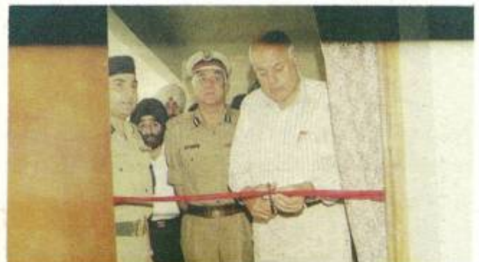
Inauguration of Women's Police Division at Srinagar