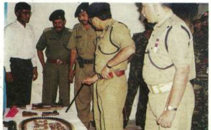
IGP Jammu Zone being shown recoveries made by Bhandarwah (Doda) Police