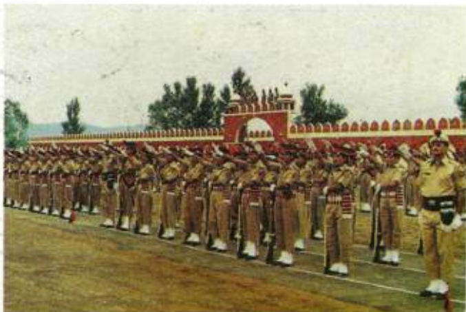
A view of the oath ceremony at Police Academy, Udhampur

Chief Minister, Dr Farooq Abdullah, inaugurated a Women Police Division in Srinagar on July 9. The Police